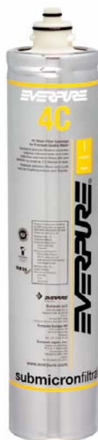
Cartuccia 4C: EV960100

Indicata per la forniture di acqua di qualità per le seguenti applicazioni: "cold cup vending applications"