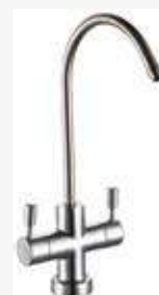
RUBINETTO - FAUCET long-reach