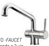
RUBINETTO - FAUCET Monocomando a 3 vie canna bassa Single-control, Three-way mixer tap - low cane