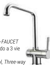
RUBINETTO - FAUCET Monocomando a 3 vie canna alta Single-control, Three-way mixer tap - high cane