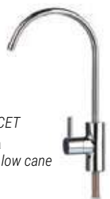
RUBINETTO - FAUCET Miscelatore a 1 via One-way mixer tap low cane