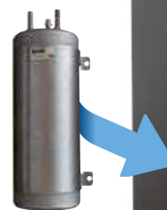
Carbonatore TOF TOF carbonator

OSMOTIC WATER DISPENSER STILL AND SPARKLING WATER AT ROOM-TEMPERATURE