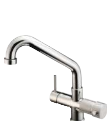
RUBINETTO -FAUCET Monocomando - a 5 vie - canna bassa Single-control - Five-way mixer tap - low cane