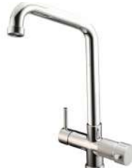
RUBINETTO -FAUCET Monocomando - a 5 vie - canna alta Single-control - Five-way mixer tap - high cane