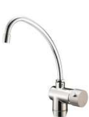
RUBINETTO -FAUCET 3 vie 3 way