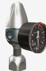
Riduttore per bombole ricaricabili con manometro di bassa pressione assiale Reducer for rechargeable gas cylinders with axial low pressure gauge