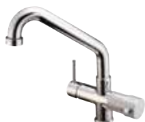
RUBINETTO -FAUCET Monocomando - a 5 vie - canna bassa Single-control - Five-way mixer tap - low cane