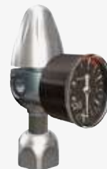
Riduttore per bombole ricaricabili con manometro di bassa pressione assiale Reducer for rechargeable gas cylinders with axial low pressure gauge