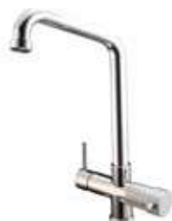
RUBINETTO -FAUCET Monocomando - a 5 vie - canna alta Single-control - Five-way mixer tap - high cane