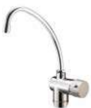
RUBINETTO -FAUCET 3 vie 3 way